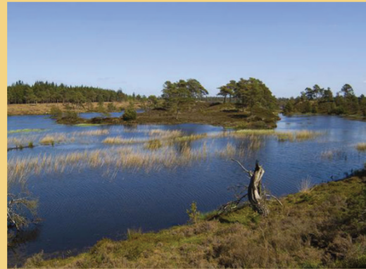
Ved Syvårsøerne kommer og forsvinder vandet på en uforudsigelig måde.