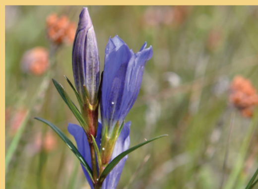
Den smukke klokkeensian vokser i moseområder ved Præsteflod og Grene Sande.

Det store flyvesandsområde syd for Billund og Grindsted er tilgængeligt via afmærkede vandreruter. Her kan du opleve heden med de op til 10 meter høje indlandsklitter, hvor det hvide flyvesand skaber en stemning som i Vestkystens hvide klitter. Blå søer titter frem i det mørke lyngtæppe og følger du stien langs kanten af Hejnsvig Bakke, på sydsiden af heden byder turen på en enestående udsigt over landskabet. Her kan du plukke tyttebær på heden og blåbær i plantagen. Du kan tage en tur på mountainbike eller tage hunden i den indhegnede hundeskov, eller svinge golfkøllen på Gyttegård Golfbane.