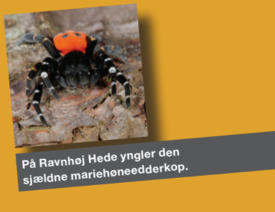
På Ravnhøj Hede yngler den sjældne mariehønedderkop.

På Kyst-til-Kyst kan du vandre på tværs af Jylland fra Vejle By i øst til Blåvands-huk Fyr i vest. En vandretur på i alt 140 km. Den afmærkede rute følger Varde Å, Holme Å og Varde Å og byder på meget varierede naturoplevelser. I Billund Kommune følger ruten den smukt slyngede Holme Å, gennem ådalens enge og moser. På en særlig smuk strækning af stien passerer du Ravnhøj hede, der ligger på den sydlige skrånt af Hejnsvig bakke. Langs Kyst-til-Kyst stien kan du overnatte på shelterpladser og primitive teltpladser, hvor der også er adgang til drikkevand. Find kort og mere information på Kyst-til-Kyststiens hjemmeside.