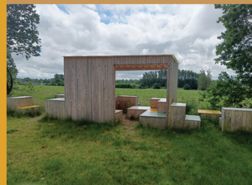
Madpakkehuset Green Lounge er anlagt som mødested for byens børn og unge.

I Stenderup-Krogager kan du gå på opdagelse i den urskovslyngede skovområde, der ligger langs Nørrebæk ved Ø-parken. Her finder du også byens legepladsen og madpakkehus. Syd for byen løber Ansager Å, hvor du kan nyde udsigten fra den lille bro ud i åen.