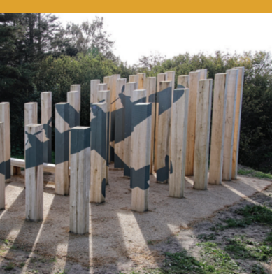
Mindesmærke over et nedskudt fly fra 2. verdenskrig.