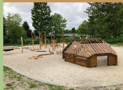
Legepladsen i Billund Anlæg er udformet som en kæmpe stor salamander.