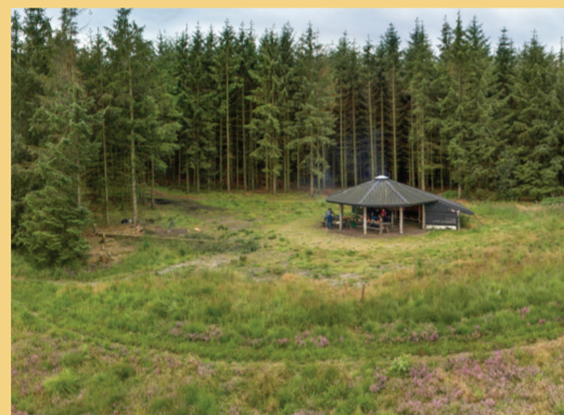
Overmatter du i shelter oplever du måske Natravns gædefulde skrig i nattens mørke.