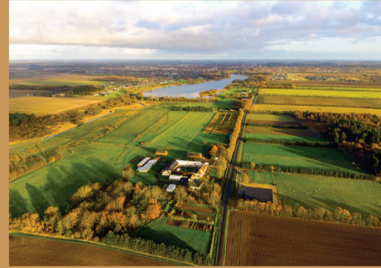
Museumsgården Karensminde ligger lige vest for Grindsted Engso.

Ved Tronsøen findes både naturfitness, afmærket ridesti, bålsted og shelters. Grindsted Engso og Grindsted Å danner en grøn kile igennem Grindstedets bymidte. Her finder du både legeplads og en 18 hullers discgolfbane. Et net af vandrestier og boardwalks gemmer både på en handicapvenlig boardwalk syd for Grindsted Sygehus og en hemmelig hule i trækroneerne i moser nord for parkerne.