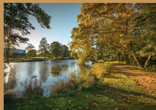
En smuk efterårsdag ved parkerne midt i Grindsted By.