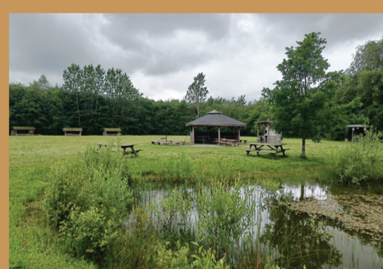
Shelterbyen i Vorbasse med 4 shelters, bålplads madpakkehus, pizzaovn og toilet.