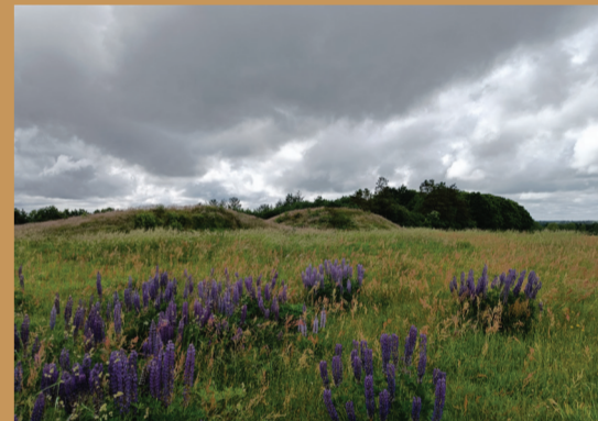
Billund Kommunes højeste punkter er at finde ved gravhøjene omkring Hejnsvig.

Hejnsvig ligger højt i landskabet på toppen af Hejnsvig Bakke. Her blev der i oldtiden placeret mange gravhøje på landskabets højeste punkter. De kan stadig ses på din tur rundt på byens hjerterstier, hvor du flere steder kan nyde smukke udsigter over det omkringliggende landskab. Madpakken eller temokaffen kan nydes i det særlige opholdssted Green Lounge. Hejnsvigs grønne område "Anlægget" indeholder både sø, skov og et madpakkehus.