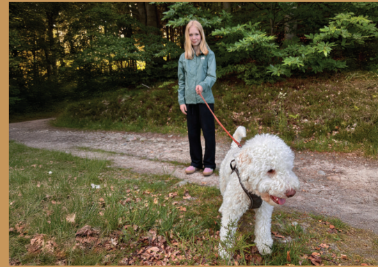
Lad din hund løbe frit i hundeskovene eller tag hunden i snor på de mange vandrestier.

Vorbasse er kendt for sit årlige Vorbasse Marked. Vorbasse har sin egen shelterby, der ligger i en lysning i et skovområde umiddelbart syd for byen. Her finder du også en lille sø samt indhegnet hundeskov. Byens legeplads findes ved markedspladsen centralt i byen. En aktivitetsakse mellem skolen og hallen slutter ved Drivvejen med en udsigtsvej "Bjerget" hvor der også er et overdækket madpakkeområde. Byens afmærkede hjerterstier fører både sydpå til Søndergård Plantage, og nordpå gennem plantagerne langs den gamle Trolldhebanen.