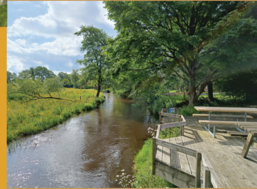
På rasteplassen ved Omme Å kan du nyde den smukke udsigt.

Anlægget i hjertet af Sønder Omme rummer både det flotte Naturrum, en bålplads og naturlegeplads. Byens hjerterstier omfatter naturskønne ruter langs Omme Å og gennem mindre skovområder både nord og syd for byen. Du kan også følge hjerterstien ud til hundeskoven i den østlige del af byen. Her kan du lege med din hund på hundelegepladsen, og slippe den fri i den indhegnede hundeskov. Der er også mulighed for at gå på oplevelsessstien gennem moser eller tage et velfortjent hvil ved shelterpladsen.