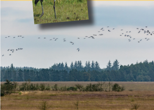
Flokke af traner ræster nu på Randbøl hede, ligesom enkelte traner yngler på heden.