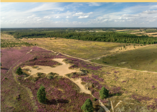
Blomstrende lynn og indlandsklitter i Grene Sande.