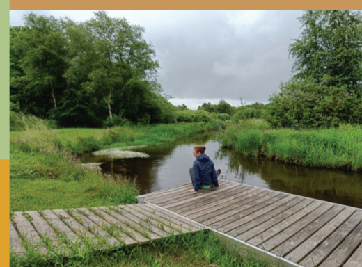
Kom tæt på åen fra udsigtsplatformen ved Ansager Å.

I Billund anlæg kan du opleve både sø, hede, blomstereng og skov. Du finder også legeplads, bålhytte og amfi-scene. En kælkebakke står klar til vinterens snevejr. Langs Skulpturstien i Billund går kunst og natur hånd i hånd. Her kan du betragte meget forskellige kunstværker, mens du bevæger dig langs den genslyngede Billund Bæk. Ved tennisbanerne finder du infotavle og folder om Fortællerstien, hvor små pastelfarvede skulpturer gemmer sig i skoven. Via Playline forbindes Skulpturstien med Billunds store turistattraktioner og bymidten. Hold øje med farverigt grafik på belægningen langs ruten. Ved vandværkskoven kan man besøge hundeskoven, hvor hunde må løbe frit.