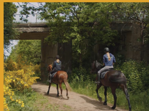
I Grindsted Plantage krydser Trolldhebanen på en viadukt henover Den Skæve Bane.

Trolldheststien er mest kendt fra Kolding Kommune. I Billund Kommune kan du også cykle eller vandre på den gamle jernbanelinje, der gik mellem Vejen/Kolding og Trolldede. Det gælder på strækningen Hejnsvig-Grindsted-Sdr. Omme, hvor ruten løber gennem de store plantageområder Utoft- og Grindsted Plantage. Flere steder langs ruten kan du opleve blomsterrige groftækker, der tiltrækker mange arter af sommerfugle.