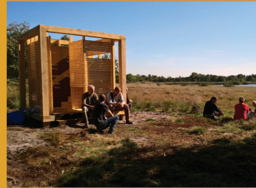
Fra fugletårnet ved Hjørtlund Sø kan du se på fugle og nyde udsigten over søen.

Filskov er udgangspunkt for Billund Kommunes eneste kløversti. På de 4 ruter af forskellig længde, kommer du forbi en række særlige udsigts- og oplevelsespunkter, der omfatter udsigtsplatform ved Omme Å, fugletårn ved Hjørtlund Sø, en hængesøjleskov og et mindesmærke for et nedstyrtet fly fra 2. verdenskrig. Ved Mergelgraven øst for byen findes både udsigtspunkt, madpakkehus og shelterplads. Filskov har også sin egen MTB-bane. Folder om kløverstien findes bl.a. ved Filskov Kro og Min Købmand i Filskov. I Anlægget ved Amsvej findes legeplads og madpakkehus.